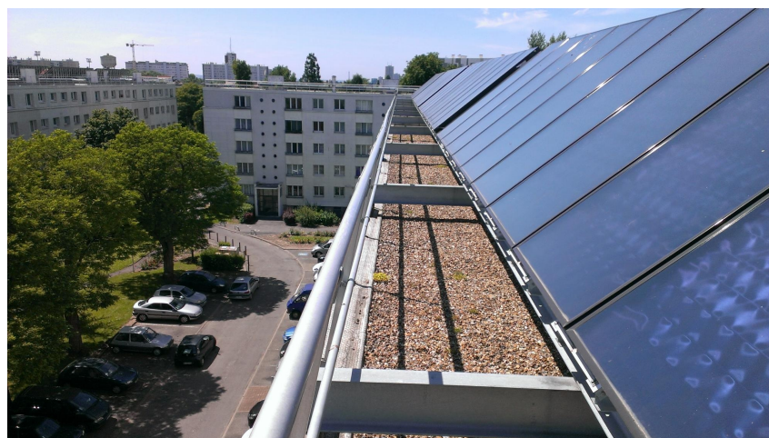
AGIR ... Lancement d'une campagne de pré-diagnostic des installations solaires thermiques défaillantes en Maine et Loire

Vous souhaitez bénéficier de la pose d'enregistreurs de température dans votre établissement ? N'hésitez plus, candidatez à ETE et bénéficiez de l'accompagnement d'un CME !