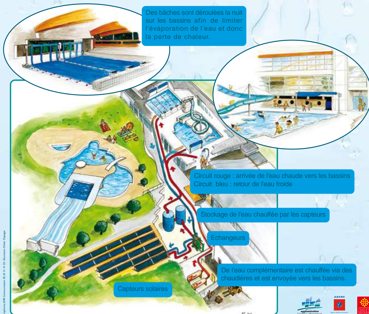
Schéma de fonctionnement

Graphisme AWB Communication 05 63 51 41 20 - Illustration Didier Diegeer