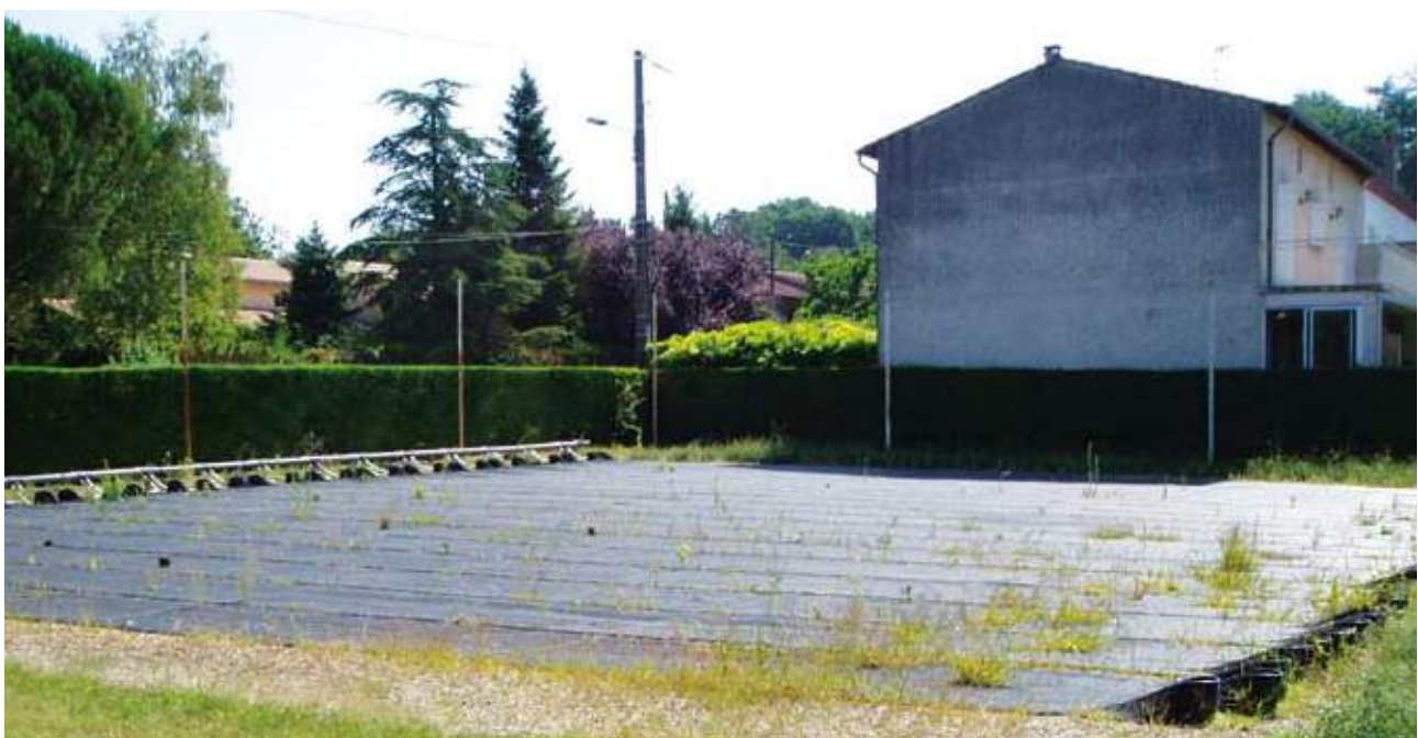
La piscine Bisséous à Castres (81) équipée de capteurs souples.