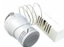
Figure 2 : Robinet avec sonde séparée