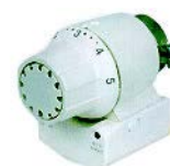
Figure 3 : Robinet programmable