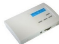
Figure 4 : Centrale de gestion thermoélectrique