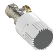
Figure 1 : Robinet thermostatique